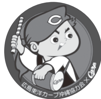
限定缶バッジ見本