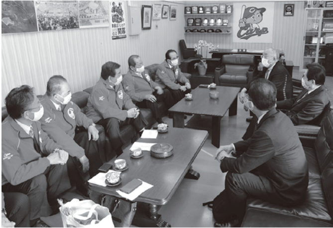
会頭室にて、松田オーナーと

2月8日(月)に広島東洋カープ松田元球団オーナーが来所しました。現在コザしんきんスタジアムにて行われている野球キャンプの話や、沖縄の食文化について語り合い交流を深めました。また同日球団よりカープ協力会に寄付金の贈呈も行われました。カープ協力会では今後も球団サポート活動を続けてまいります。