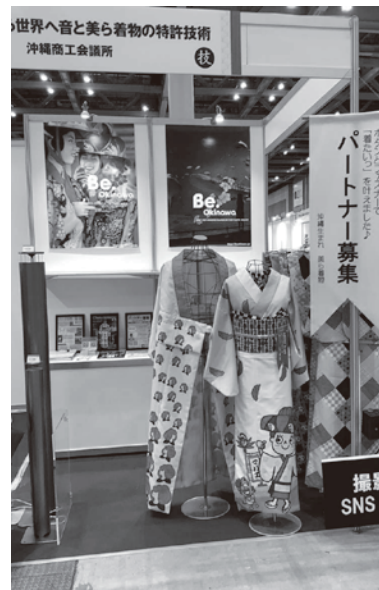
真奈企画(株)「美ら着物」

参加者からは次回もチャレンジしたいと要望がありました。今後とも事業所さまが県外への新規販路開拓に繋がれるよう、当会議所は継続して支援していきます。