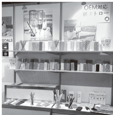
(同)HAPPY JOY 「紙ストロー」