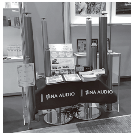
(有)知名御多出横 「オリジナルスピーカーアンプ」