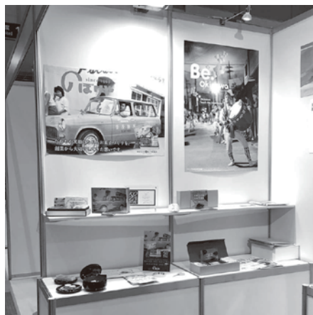
のぼりや製菓(有) 「沖縄菓子ゆーめく」