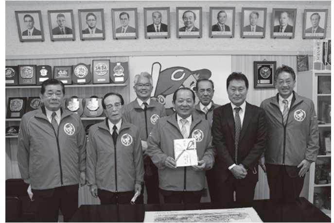
球団より寄付金の贈呈