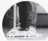
モップ・雑巾の除菌