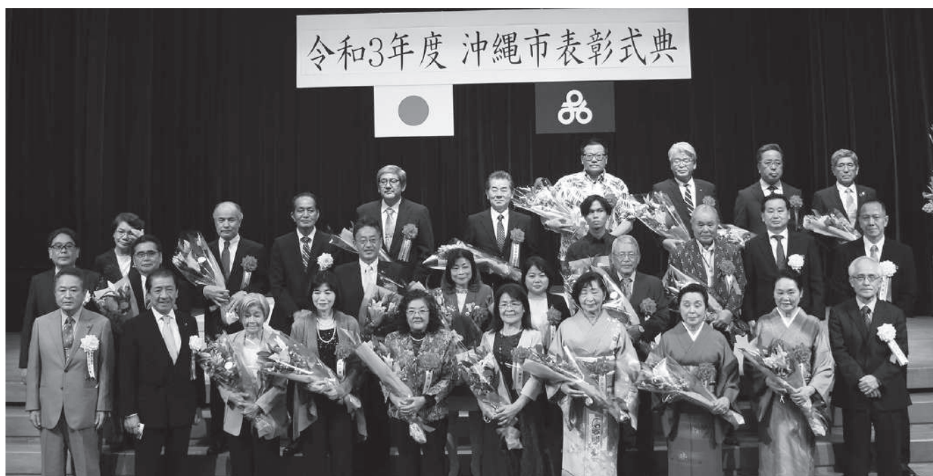
令和2年度沖縄市表彰式典