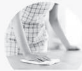
手すり・テーブルの除菌