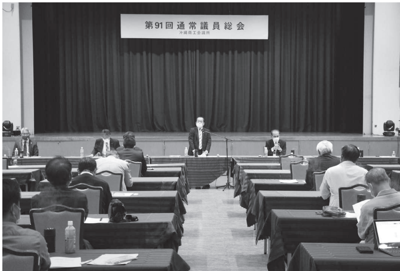
第91回通常議員総会

第91回通常議員総会を3月29日(月)日本ブライダルセンター(NBC)にて開催し、令和3年度事業計画・各会計予算が承認されました。