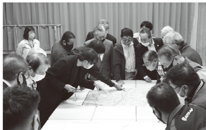
活発な質問が寄せられた個別説明