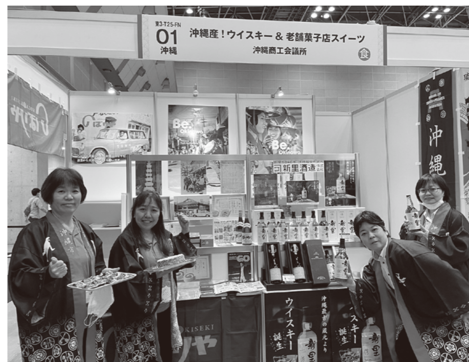
feelNIPPON出展メンバー全員女子!!

バイヤーとの名刺交換、見積依頼、百貨店ECサイトへの商品登録等商談に繋がる案件もありました。今後とも県外への新規販路開拓にチャレンジできるよう継続して支援していきます。