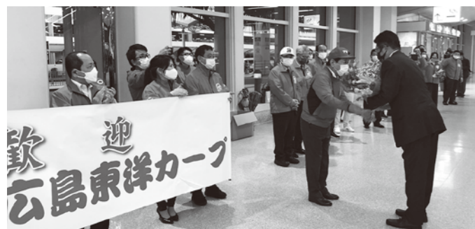
空港で監督へ花束贈呈

また、今回は練習試合がしんきんスタジアムで1試合行われ、那覇・名護にてオープン戦がそれぞれ開催されました。春季キャンプの運営補助など今後も沖縄協力会は広島東洋カープを応援していきます。