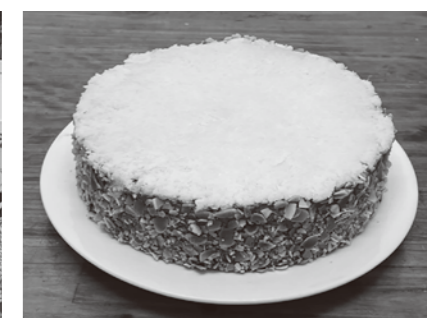
のぼりや製菓「ジャーマンケーキ」