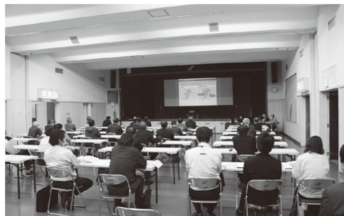
県土木事務所職員による概要説明

池武当IC及び周辺道路整備については、部会員からの関心も高く、活発な質問が寄せられていました。