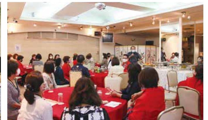
総会後の懇親会にて、親睦を深めました