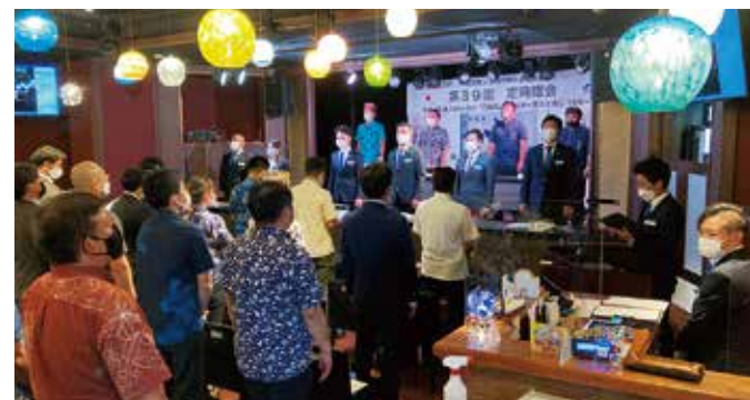
県連YEG総会を宮古島にて開催

令和4年度は九州の商工会議所青年部が集まる九州ブロック大会が宮古島にて開催されます。この第42回九州ブロック大会宮古島大会に向け、沖縄県商工会議所青年部一丸となって取り組んでいきますので、今年度も青年部の活躍を見守っていただくとともに、事業運営にあたって皆様のお力添えを賜りますようご協力よろしくをお願いいたします。