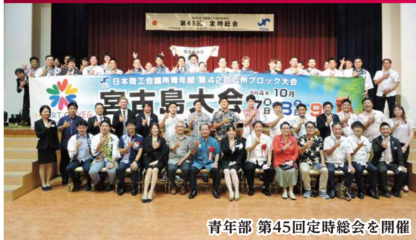
青年部 第45回定時総会を開催

KARAHAI [からはい] www.okinawacci.or.jp 沖縄商工会議所 会報誌 2022年 July