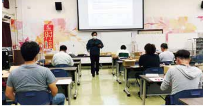
第2種電気工事士受験対策講習会

今回は、筆記対策に9名、技能対策に8名が参加し、資格取得へ向けて熱心に取り組んでいました。多くの方が資格を取得し各事業所で活躍されることを祈念致します。