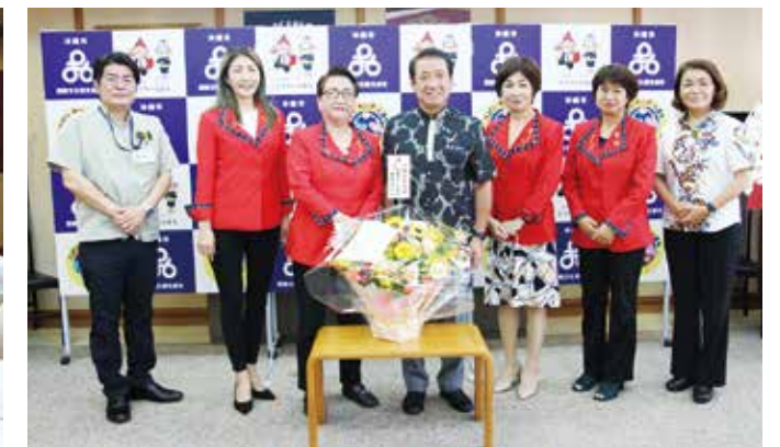
桑江市長、与那嶺副市長と