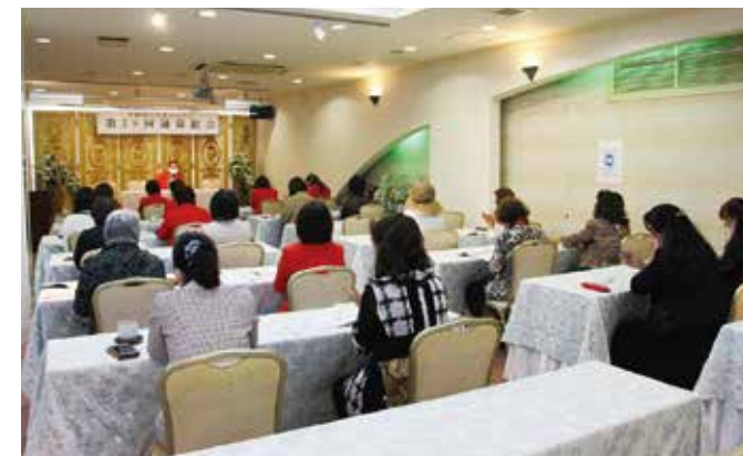
議案審議の様子、全会一致で承認いただきました