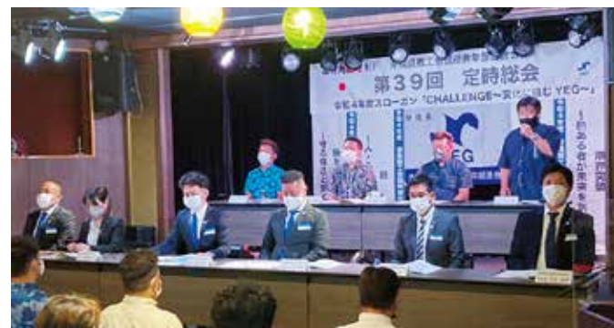
県連YEG直前会長挨拶