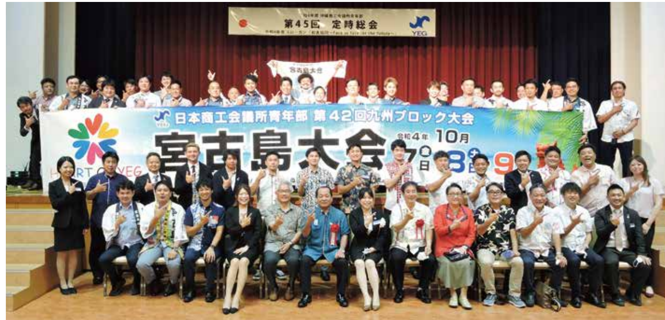
九州ブロック大会宮古島大会のPR