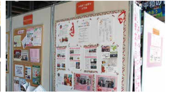
沖縄商工会議所女性会の展示パネル