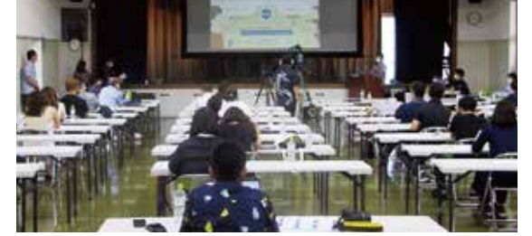
優良県産品推奨事業説明会の様子

去った7月20日(水)に沖縄商工会議所ホールにて令和4年度沖縄県優良県産品推奨事業の説明会を開催しました。優良県産品推奨事業の事務局である株式会社クロックワークをはじめ沖縄県、琉球新報社、みらいおきなわの4社が講師として説明を行い、30事業所のみなさまに受講いただきました。