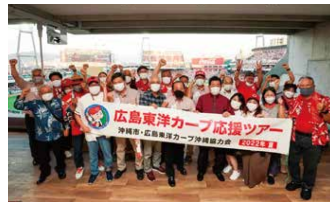
参加者みんなで記念撮影