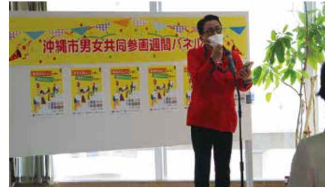
パネル展開会式にて、当女性会 宮城会長によるあいさつ

当女性会でも、男女共同参画に対し正しい知識を持ち、高い意識を持って活動していきたいと感じました。