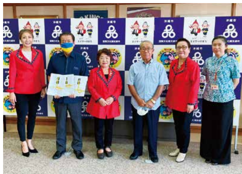
贈呈式後に、桑江市長と

長期に渡り緊張の解けないウクライナとロシアの情勢ですが、故郷を離れ、遠い沖縄市の地に避難された方々にとって、今回の贈呈が少しでも手助けになれば幸いです。