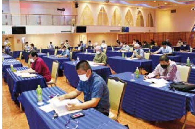
第94回通常議員総会風景

本日、ここに沖縄商工会議所 第94回通常議員総会を開催いたしましたところ、公私ともにご多忙の中、議員の皆様のご参加を賜り、厚く御礼を申し上げます。