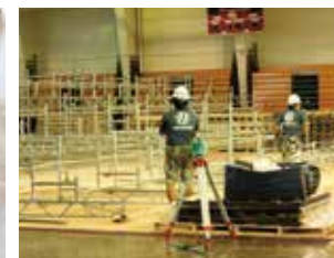
国際事業(米軍基地)