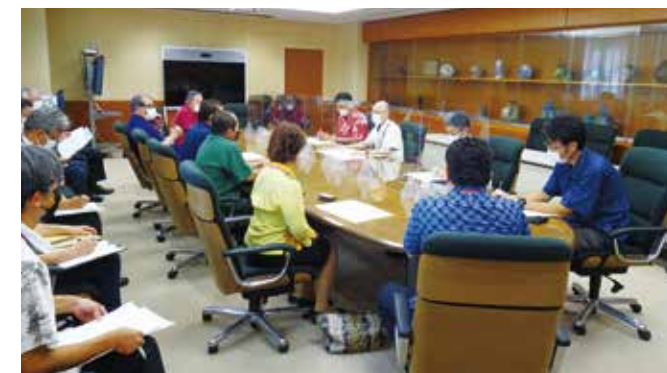
沖縄総合事務局長への要請