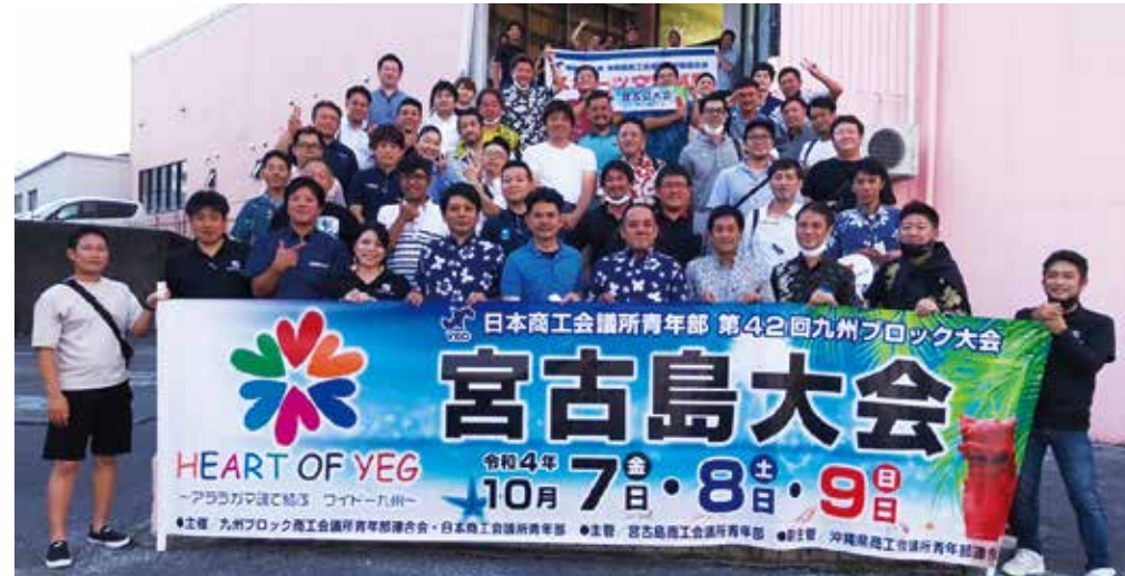
県連YEGメンバー in ドラゴンボウル

また、沖縄商工会議所青年部では、九州ブロック大会宮古島大会において沖縄市での視察ツアーを企画するなど活発に活動しております。青年部に入会することで、自己研鑽・情報収集に繋がり、広い人脈を築くことができます。20歳以上45歳以下の代表者並びに後継者、幹部従業員の方がご入会いただけますので、是非この機会にご検討ください。