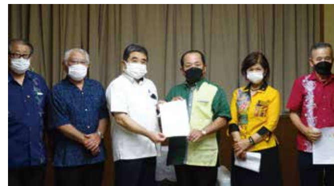
沖縄県知事への要請

今後とも、本市の活性化へ向け、早期に当該計画が実現できるよう、これからも国や沖縄県に対し要請して参りたいと考えておりますので、皆様のさらなるご支援・ご協力をお願い致します。