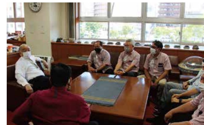
オーナー表敬の様子