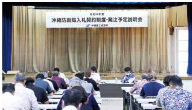
沖縄防衛局入札制度・発注予定説明会

本説明会へは、沖縄商工会議所議員、建設業部会員から56名の方々が参加されました。