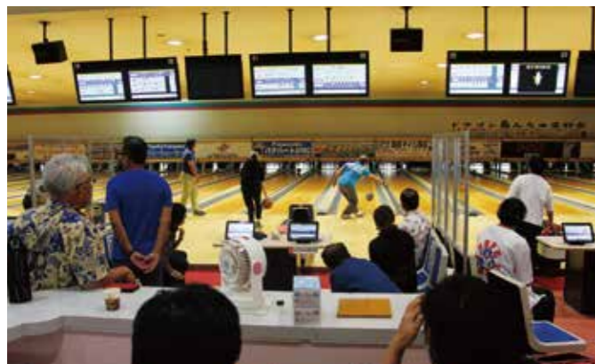
目指せハイスコア! 皆さん楽しんでいました

(株)花儀社、(有)しまや酒店、(同)未来電気設備、(株)土と根、比屋根化成(株) リザンシーパークホテル谷茶ベイ、ファミリーストア、沖縄タイムス社(中部支社)、(株)仲本工業 (有)翔土質エンジニア、拓南製鐵(株)、(株)もりお・沖縄、コザ信用金庫、(有)丸喜産業 コザ信用金庫 本店営業部、味自満チェーン、(株)TDS、(株)南日本警備保障、オーシャンモーターズ (株)KPG HOTEL&RESORT、(有)晃永調査測量、(株)ナカモト電気管理事務所、琉球銀行 コザ十字路支店 琉球新報 中部支社、(有)エレメンツ、大喜工業(株)、中部ガス事業(株)、(株)ベースクリエート (株)仲本ファブテック、(株)テクノ工業、(株)薬正堂、(株)城岩興業、輝工業、沖縄銀行 コザ支店 (株)ウォータージャパン、Hikari House Cleaning、キングラン沖縄(株)、ビューティーサロン美樹 (有)嘉手納商事、(有)ステーキハウス ビッグハート、(有)内盛産業、Hair make クローバー (有)クリーンガス、(有)デザインワークスオンリーワン、(有)クリーンアイランド、(株)琉球保安警備隊 トーケン・システムコントロール、(有)フラット (順不同)