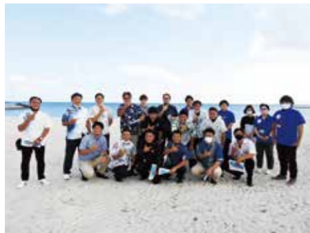
天気にも恵まれた潮乃森