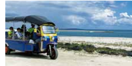
トゥクトゥク試乗体験