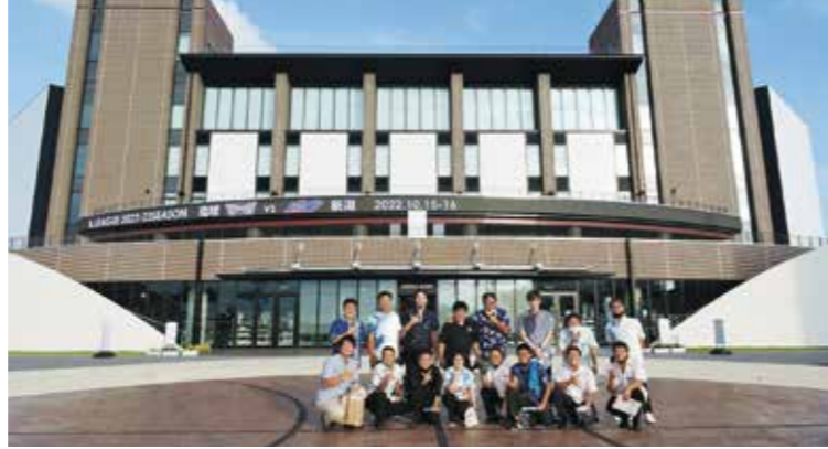
施設内を隈なく見て回った沖縄アリーナ

去った10月7日(金)九州ブロック大会宮古島大会の分科会として県内視察を実施し、モータースポーツマルチフィールド沖縄、東部海浜開発地区(潮乃森)、沖縄アリーナを視察しました。各施設のご担当者様から設備などについて説明していただき、地域振興について改めて考える機会となりました。また、当日は沖縄商工会議所青年部OBの皆様にもご参加いただき、今後の青年部活動についても改めて見直すことができた事業となりました。