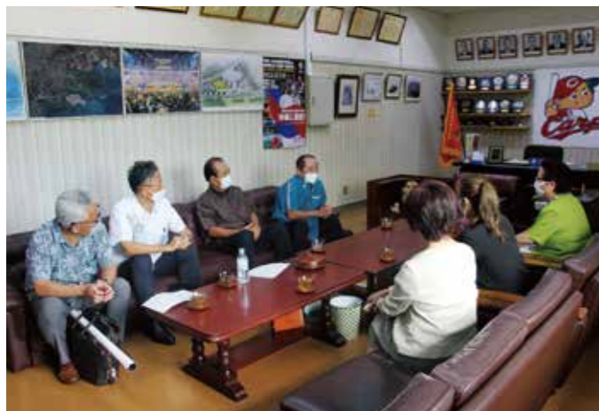
周年事業に向けた気運作りのアイデア等について話し合いました

当女性会は、今後とも、沖縄商工会議所と共に更なる発展を目指して活動していきます。