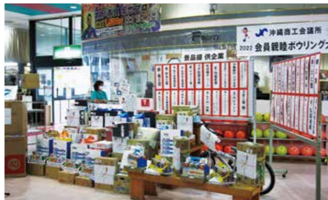
たくさんの景品提供ありがとうございます!