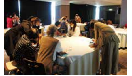
実際に操作をしながら機能をチェック