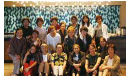
参加者の親睦が深まりました