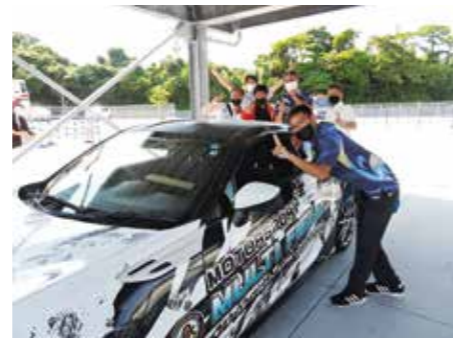
ハチログ体験乗車(助手席)させていただきました!