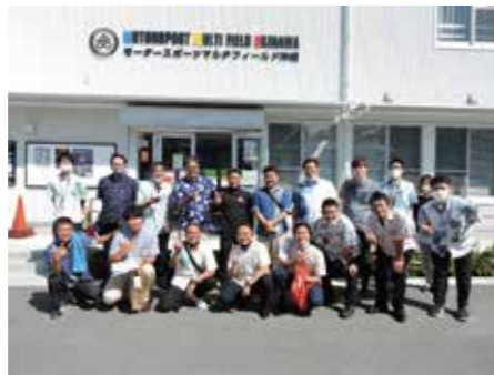
迫力満載だったモータースポーツマルチフィールド沖縄