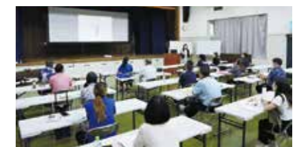
真剣に受講する受講生の皆様