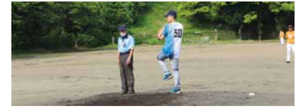
仲本副会頭による始球式