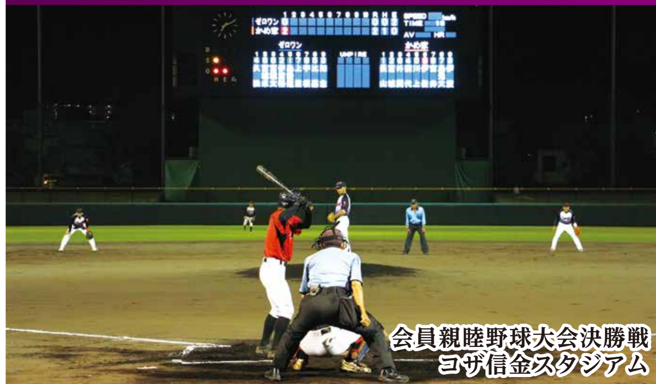
会員親睦野球大会決勝戦 コザ信金スタジアム