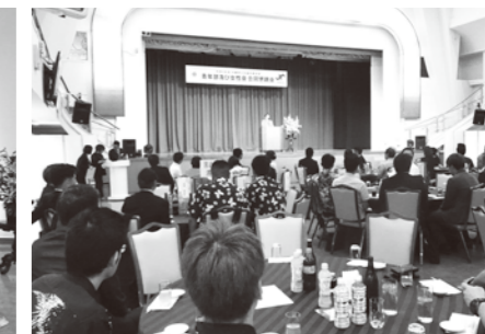
数年ぶりに青年部との合同開催となる懇親会