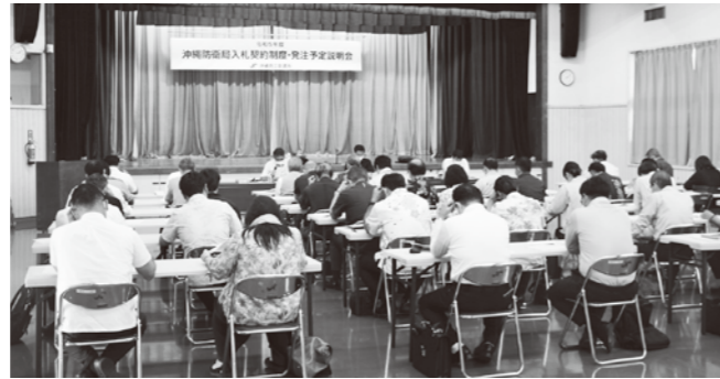
沖縄防衛局入札制度説明会

本説明会へは、沖縄商工会議所議員、建設業部会員から41名の方々が参加されました。