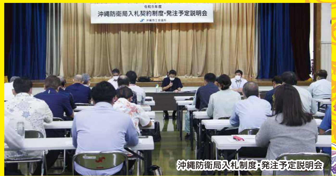
沖縄防衛局入札制度・発注予定説明会