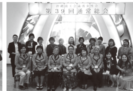
総会後に会員一同にて