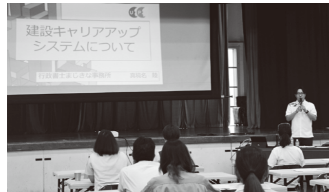
真境名陸氏による説明