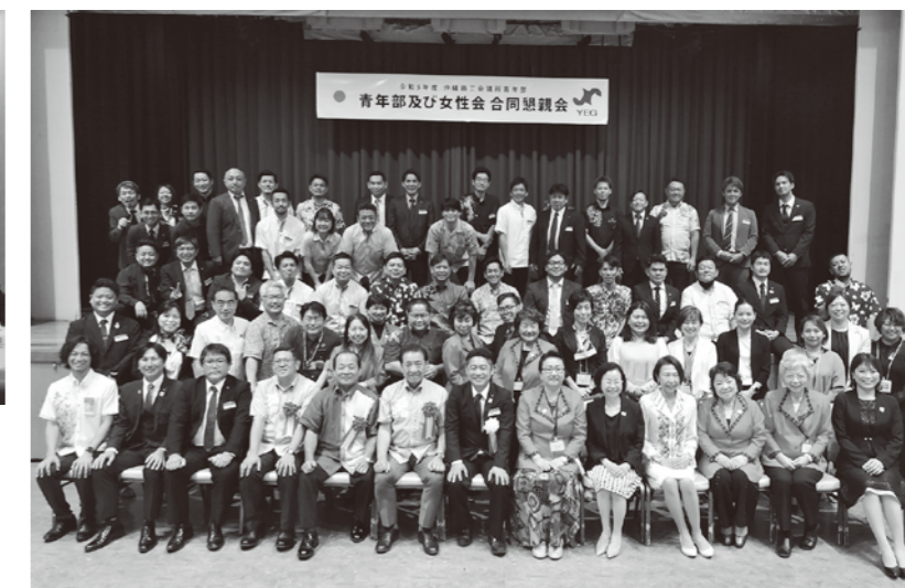
総会後の女性会合同懇親会