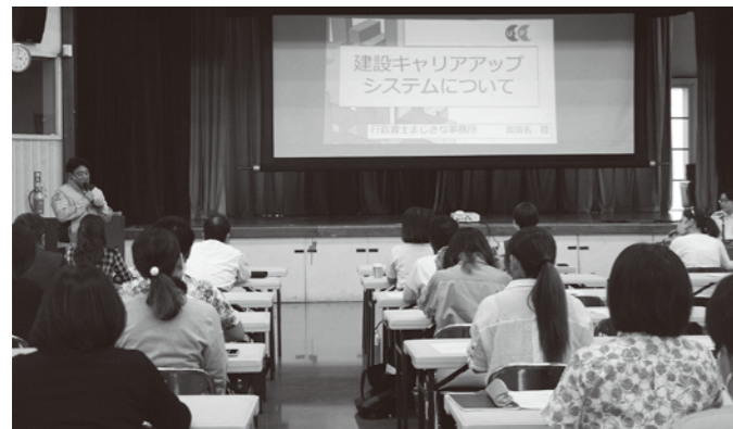
建設キャリアアップ制度説明会

本説明会へは、沖縄商工会議所議員、建設業部会員から35名の方々が参加されました。