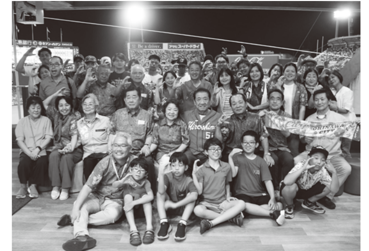
参加者で記念写真