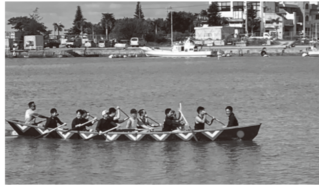
ハーリー大会、全力で漕ぎました!

沖縄商工会議所青年部は、6月25日(日)に浜川漁港で開催されました「第15回北谷ニライハーリー」へ参加致しました。前年度に引き続き(一社)沖縄市観光物産振興協会青年部、北谷町商工会青年部など各団体との交流の他、部員同士の交流もあり、大いに盛り上がりを見せました。ビーチイベントを開催した沖縄市潮乃森でのハーリー大会の開催及び足掛かりとなるよう、これからも取り組んでいきたいところです。