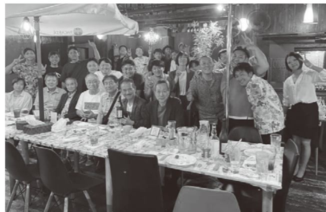
待ちに待った、大村YEGとの交流会

沖縄商工会議所青年部は、長崎県大村市にある大村商工会議所青年部と昭和58年7月に姉妹提携を結び今年40周年を迎えます。6月にオンラインで交流、そして同月に沖縄で対面交流を致しました。貴重な意見交換の場となり、9月30日に大村市で開催される沖縄・大村YEG姉妹縁組40周年記念式典でも更に盛り上げられるよう訪問準備を進めていきます。