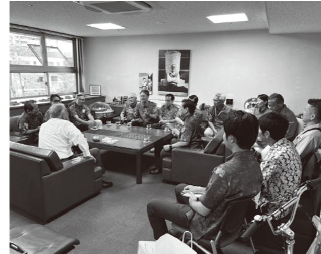
オーナー表敬の様子