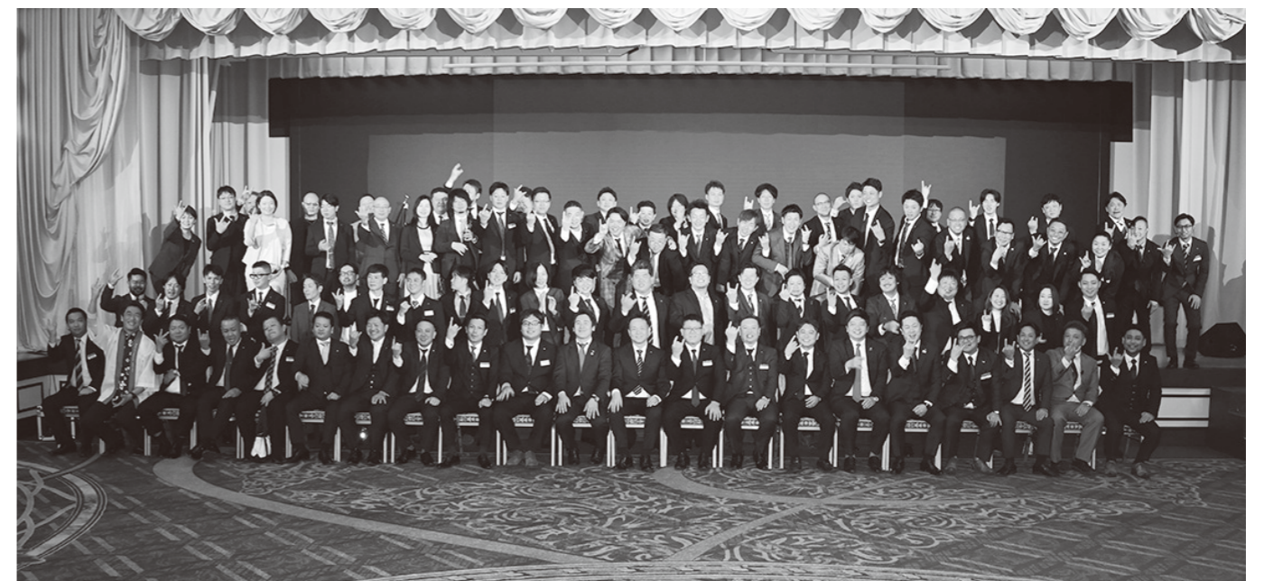
祝賀会後の集合写真