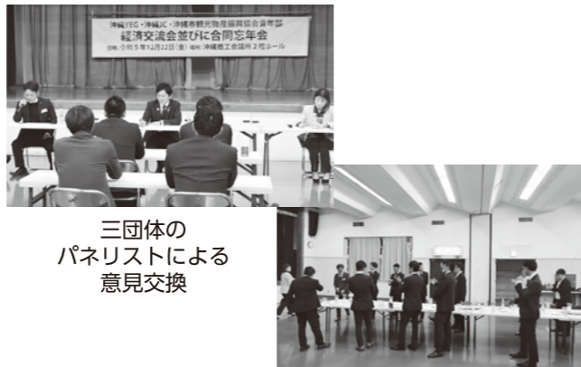
三団体のパネリストによる意見交換