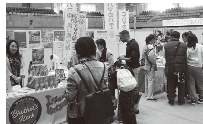
たくさんの方々に来場いただきました