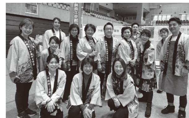
2日間おつかれさまでした!

今回の収益の一部は、福祉施設への寄付金とする予定です。ご来場いただいた皆様、ありがとうございました。