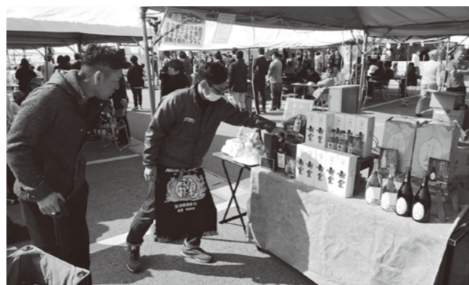
新里酒造ひときわ目を惹きます