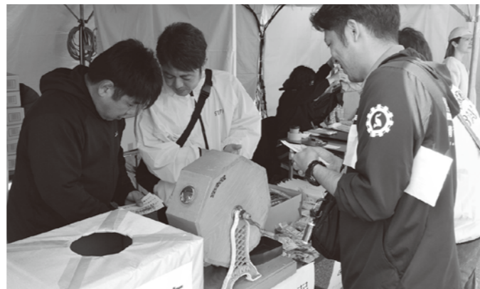
会場案内やガラボン対応に奔走