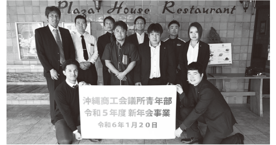
新年会事業集合写真

去った1月20日、沖縄市久保田にある、プラザハウス内の月苑飯店にて新年会事業を執り行いました。新年初めての事業であると同時に、今年度は僅かな事業を残すのみであること、今一度自身の事業を見つめ直したり、新年から部員と交流をもてる場となりました。