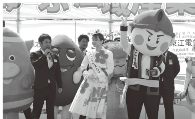
ゆるキャラ大集合! ミスハイビスカスにもお越し頂きました