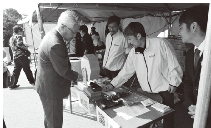
島袋副会頭もガラボンに挑戦!