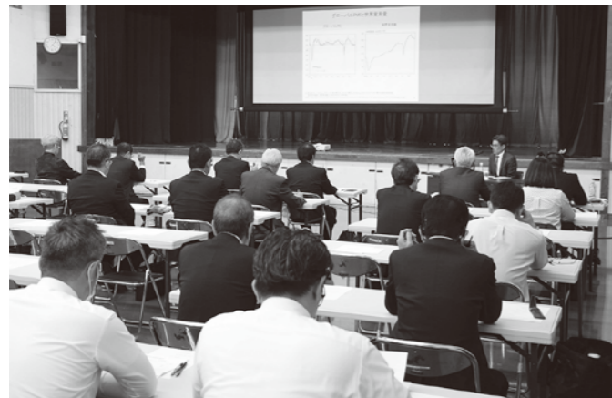
経済講演会の様子