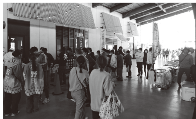
観光協会さんの特産品エリアも大にぎわいです