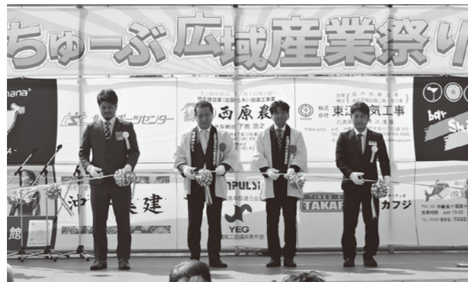
オープニングセレモニーにてテープカットの様子

去った2月11日、第9回ちゅーぶ広域産業まつりが西原さわふじマルシェにて開催されました。主催である沖縄県商工会青年部連合会中部支部の中城、うるま、嘉手納、北中城、宜野湾、北谷、読谷、そして西原の8市町村の商工会青年部と沖縄商工会議所青年部が『沖縄の中心「ちゅーぶ」から沖縄を元気に!』をテーマに一同に集い、各市町村のPRや地域の方々との触れ合い、地域団体・構成員同士のビジネスの確立までを見通したイベントとなっております。沖縄YEGからは新里酒造(株)が出店、多くの人々が試飲を楽しまれました。沖縄市の特産品枠では一般社団法人沖縄市観光物産振興協会さんより、ゆるキャラとミスハイビスカスの派遣のご協力を頂きました。抽選会ではたくさんの方が抽選結果に一喜一憂するなどして会場は大盛り上がりとなりました。第10回は沖縄市が開催予定地となっております。中部地区商工業者であれば出店資格がありますので来年のちゅーぶ広域産業まつりにご期待ください!