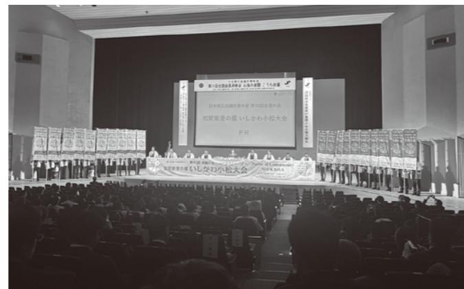
開催地PRの様子。気迫に満ちています。