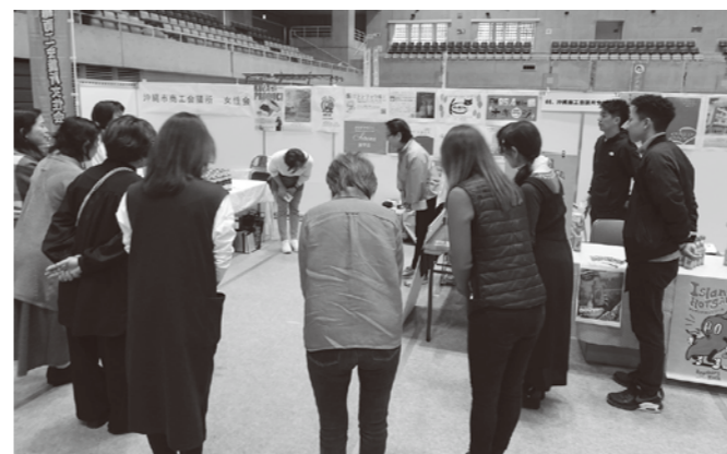
2日間がんばりましょう!