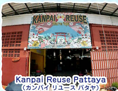
Kanpai Reuse Pattaya (カンバイリユースパタヤ)

優しい地球環境への取り組みを目指すために、不要となった品物は海外へリユースしたのち、新たな持ち主の元へ繋いでいきます。