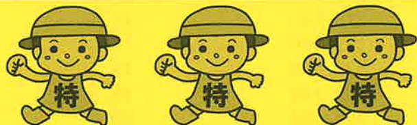
毎月勤労統計調査「特別調査」キャラクター「とくちゃん」